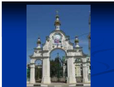
Старое здание церкви Свято – Троицкого прихода.