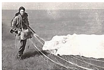
Кружок учебно-авиационного центра (УАЦ) г. Ростова-на-Дону 1963-1965 гг.

В течение всего обучения в школе посещала многие кружки: рукоделие, кружок юного железнодорожника, лёгкой атлетики, драматический кружок, кружок немецкого языка и парашютный кружок учебно-авиационного центра г. Ростова-на-Дону (УАЦ, а ранее ДОСААФ).