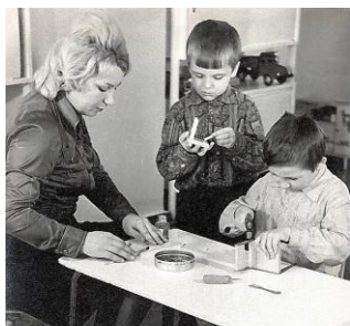
Трудовое обучение с детского сада Детский сад № 12 «Берёзка». 1976 г.

С 12 марта 1969 года стала работать в ясли-саде № 12 ГорПромКомбината до 1990 года, по месту жительства.