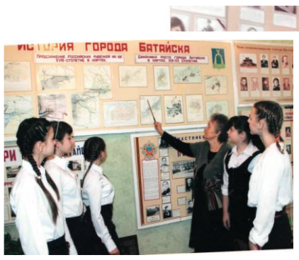
В школьном музее

- Мне пришлось восстанавливать музейный архив буквально по крупицам, организовывать работу поисковых отрядов: ребята изучали историю батайских улиц, биографии интересных людей, сами встречались с очевидцами исторических событий, записывали и фотографировали, - вспоминает учительница.