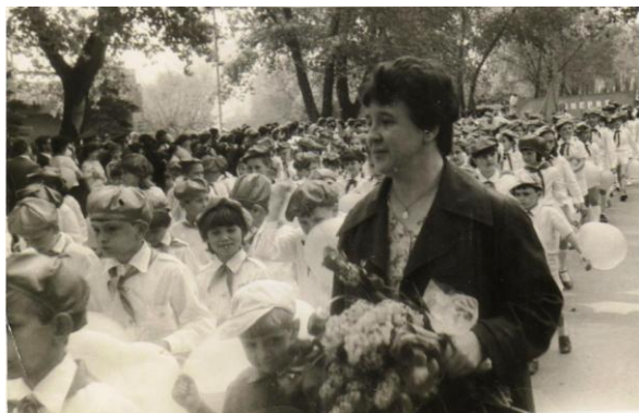
В Батайске на празднике Первого мая

Каким бы ни было её настроение, самочувствие, она на вопрос «как жизнь?», «как дела?» отвечает однозначно и по-молодецки задорно: «И всё равно хорошо!»