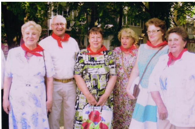
Встреча одноклассников. 60 лет со дня выпуска

Таких, как наша мама, сотни батайчан, может, даже тысячи. Но они не прошлое, они наше настоящее, они – это лучшие традиции, они – стражи священной памяти людской, они – что-то универсальное, не подвластное времени.