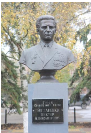
Бюст на Аллее Славы в г.Батайске

Куммерсдорф (40 км южнее Берлина, Германия). 30 апреля 1945 года он подбил 2 танка и 2 БТР врага. Когда противник окружил батарею, сражался до последнего снаряда и патрона. Прорываясь из окружения, вступил в рукопашную схватку, уничтожил гранатой пулемет и несколько гитлеровцев. Член КПСС с 1945 года. В 1948 году старшина Богданенко был демобилизован. Жил и работал в Батайске. Долгое время возглавлял городской совет ветеранов. Умер 9 мая 2002 года в г. Батайске Ростовской области, был последним из живых батайчан — Героев Советского Союза. В 2005 году на Аллее Славы мемориального комплекса «Клятва поколений» установлен бюст.