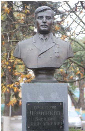
Бюст на Аллее Славы в г.Батайске

Бюст Героя установлен в 2005 г. на Аллее Славы мемориального комплекса «Клятва поколений» г.Батайска.