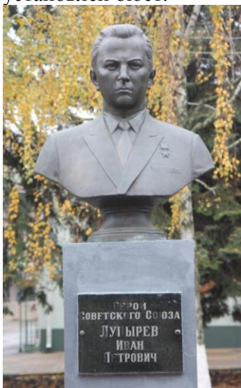
Бюст на Аллее Славы в г. Батайске

В 2005 году на Аллее Славы мемориального комплекса «Клятва поколений» установлен бюст.